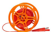
Przewód 20 m czerwony 1 kV na szpuli (wtyki bananowe) WAPRZ020REBBSZ