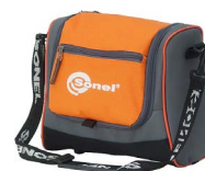
Futurał M-6 WAFUTM6