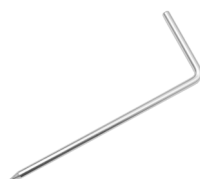
Sonda pomiarowa do wbijania w grunt (25 cm) WASONG25