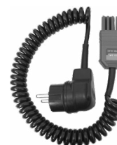
Adapter WS-05 (wtyk kątowy UNI-Schuko) WAADAWS05