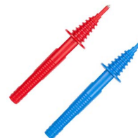
Sonda ostrzowa 1 kV (gniazdo bananowe) czerwona / niebieska WASONREOGB1 WASONBUOGB1