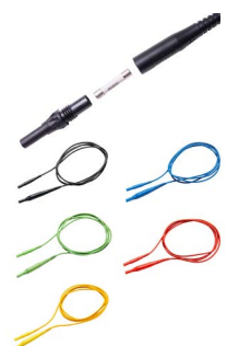
Przewód pomiarowy 2 m z bezpiecznikiem 10 A CAT IV 1000 V czarny / niebieski / zielony / czerwony / żółty WAPRZ002BLBBF10 WAPRZ002BUBBF10 WAPRZ002GRBBF10 WAPRZ002REBBF10 WAPRZ002YEBBF10