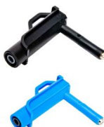
Adapter napięciowy magnetyczny - kolor czarny / niebieski WAADAUMAGKBL WAADAUMAGKBU