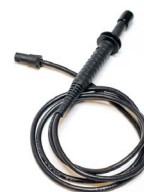
Sonda bezdotykowa WASONBDOT