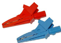
Krokodylek 1 kV 20 A czerwony / niebieski WAKRORE20K02 WAKROBU20K02