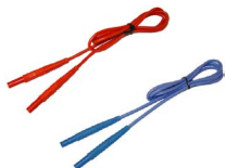
Przewód 1,2 m 1 kV (wtyki bananowe) czerwony / niebieski WAPRZ1X2REBB WAPRZ1X2BUBB