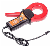
Cęgi pomiarowe C-8 WASONCEG8