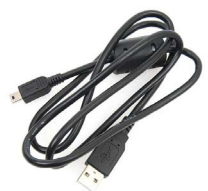
Przewód do transmisji danych mini-USB WAPRZUSBMNIB5