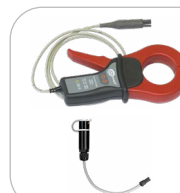
Cęgi pomiarowe C-3 WACEGC3OKR