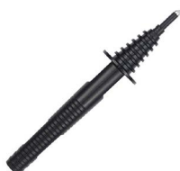
Sonda ostrzowa czarna 11 kV (gniazdo bananowe) WASONBLOGB11